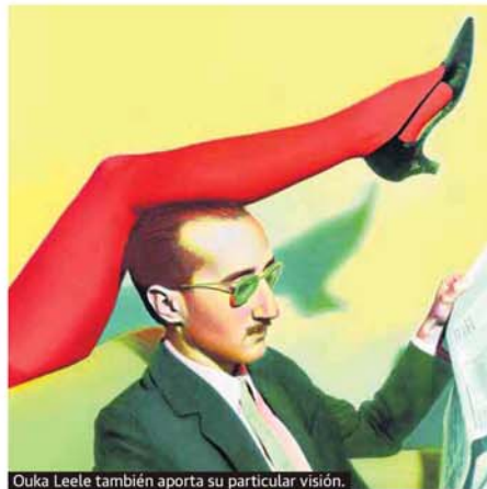
Ouka Leele también aporta su particular visión.